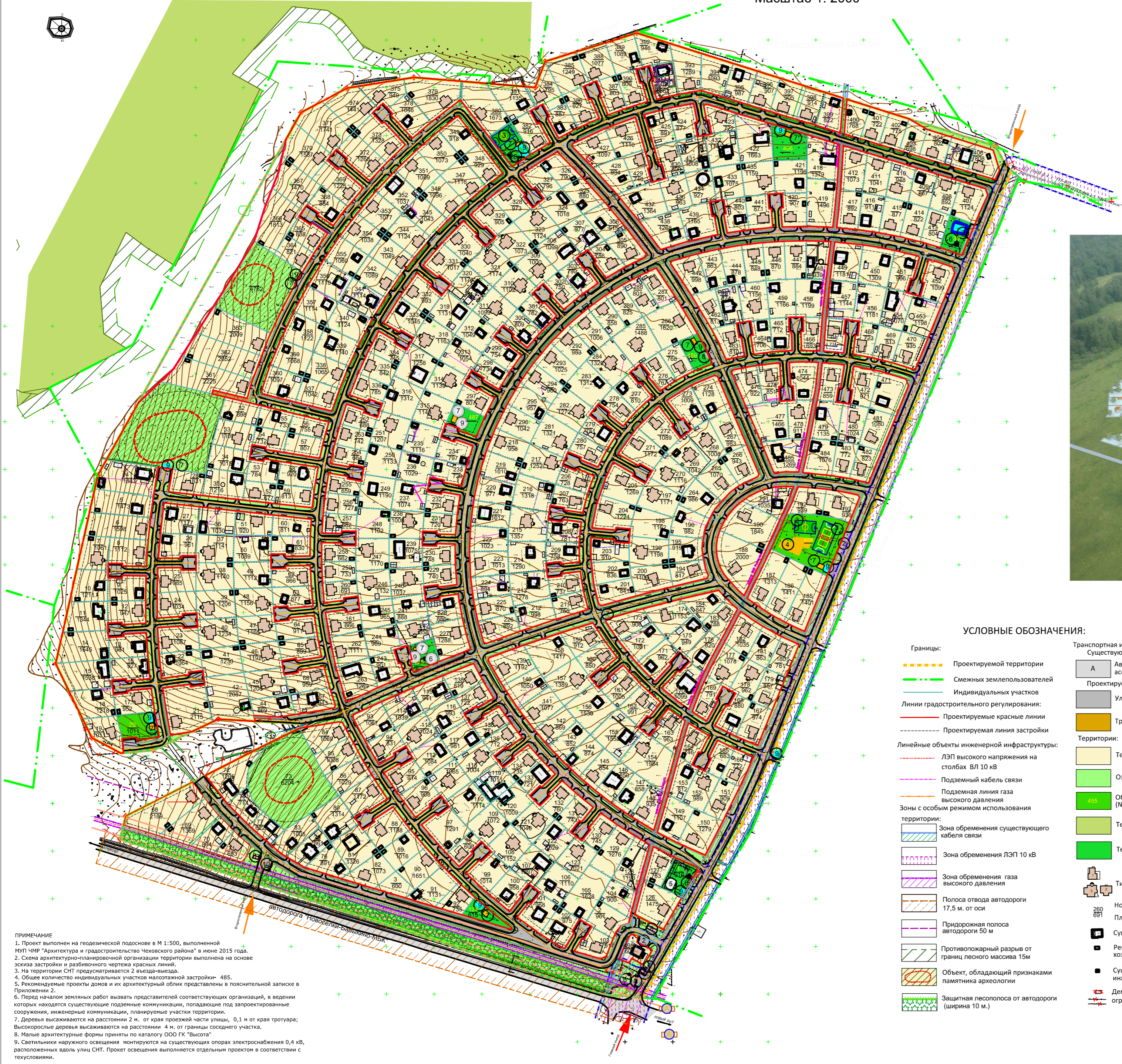
Схема архитектурно-планировочной организации территории. Схема благоустройства и озеленения территории. Масштаб 1: 2000